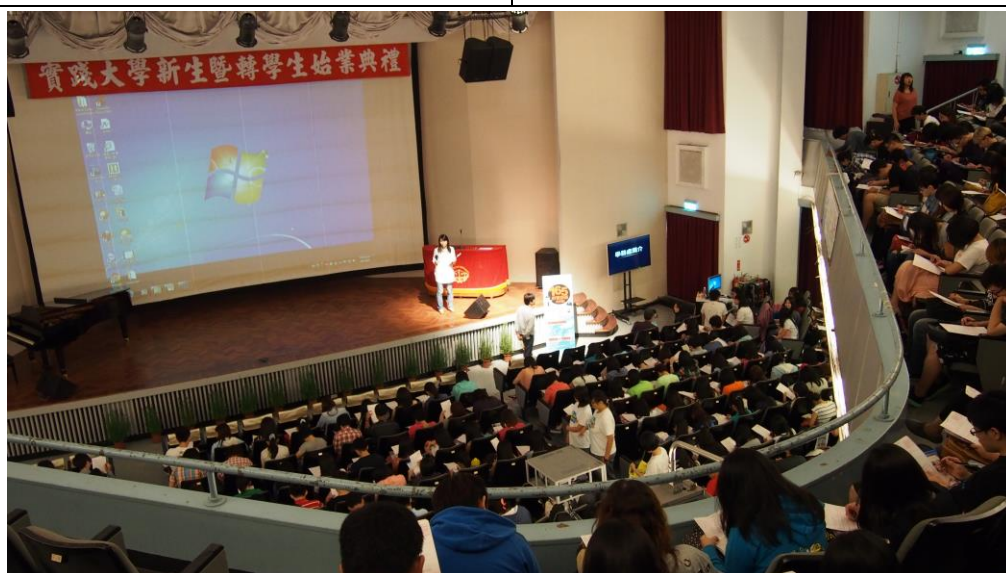
參與學生進行問卷填寫。