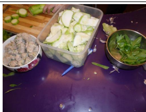
本次實作內容：絲瓜貢丸米粉。