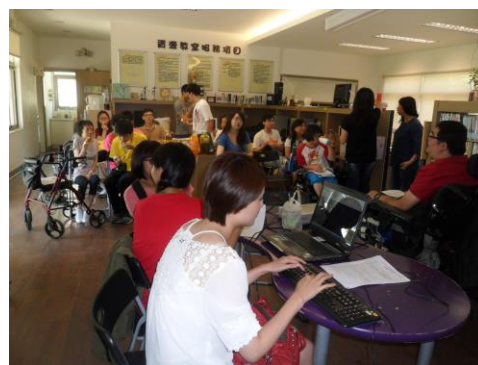
議題探討，票選聖誕晚會總召及各小組組長人選和負責內容。