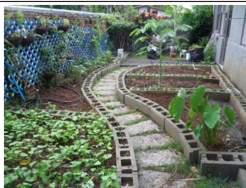
重整後等待播種的新園地。