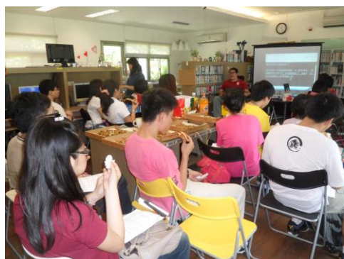
資源教室服務簡介與本學期各大活動宣傳及成員募集。