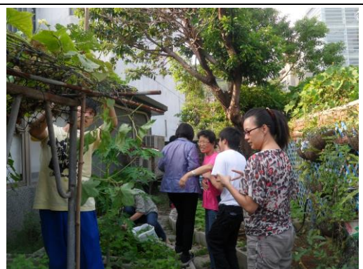
老師帶領進行後院改造。