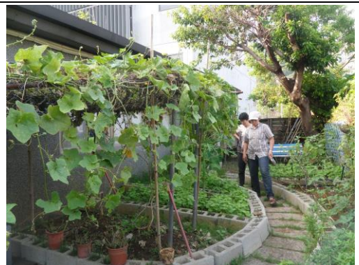
整地前後花園原貌。