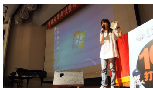
院輔導老師進行性平及自殺防治宣導。