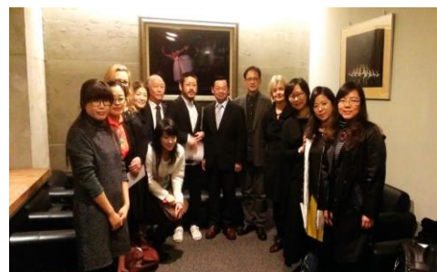
國際研討會校長及設計學院院長與嘉賓合照。