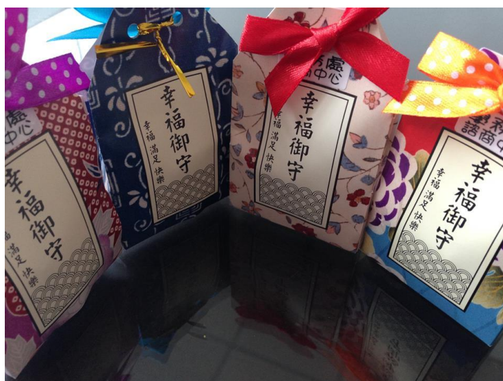
學生製作「幸福御守」獻給與會的導師，希望為導師們帶來更多的溫暖與祝福。