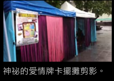
神祕的愛情牌卡擺攤剪影。