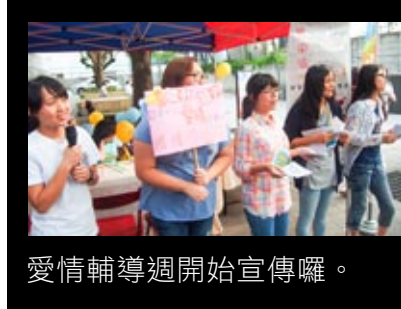
愛情輔導週開始宣傳囉。