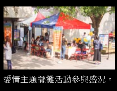
愛情主題擺攤活動參與盛況。