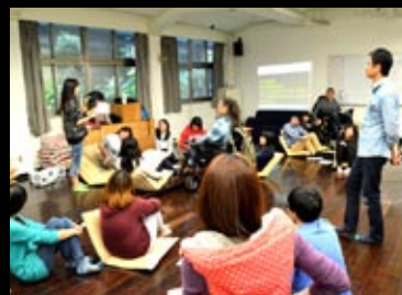
英雄路上的貴人與故事。