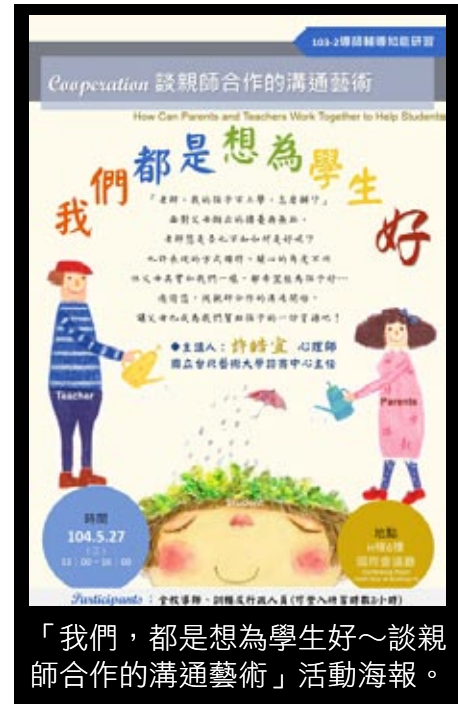
「我們，都是想為學生好～談親師合作的溝通藝術」活動海報。

這次諮商中心邀請到「爸媽冏很大」的親職教育專家－許皓宜心理師，透過實務經驗的分享與互動案例的演練，協助老師與父母建立良好的關係、相互合作及溝通，讓孩子在求學過程中，能夠有更完整的資源與後盾。