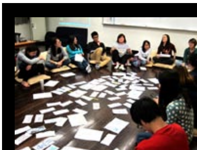
活動總回饋與分享。